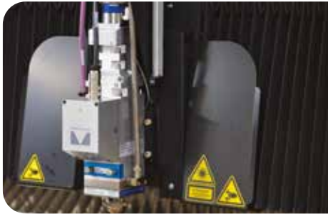
Schneidkopf mit motorisierter Fokulinse