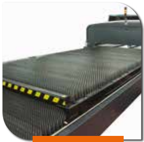
Palettenwechsler zum Be-/Entladen